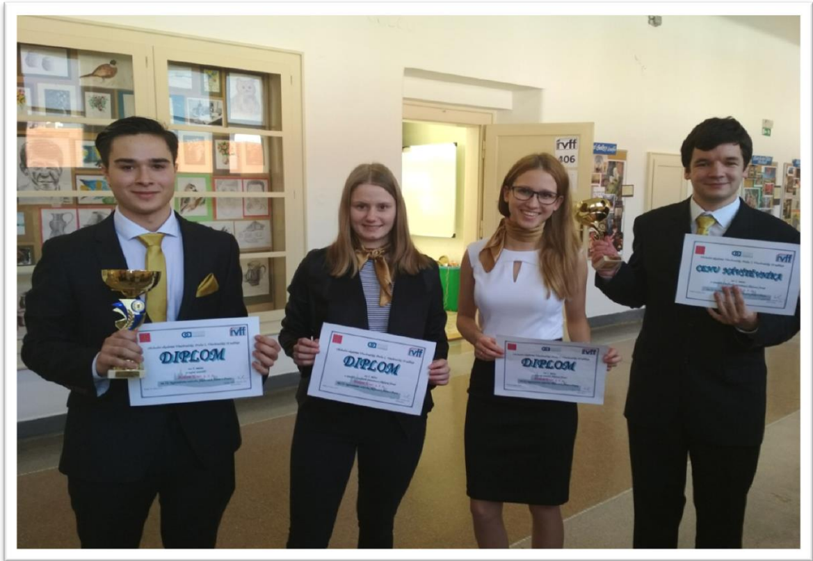
Bohem Tour, s. r. o. (žáci 3. C)