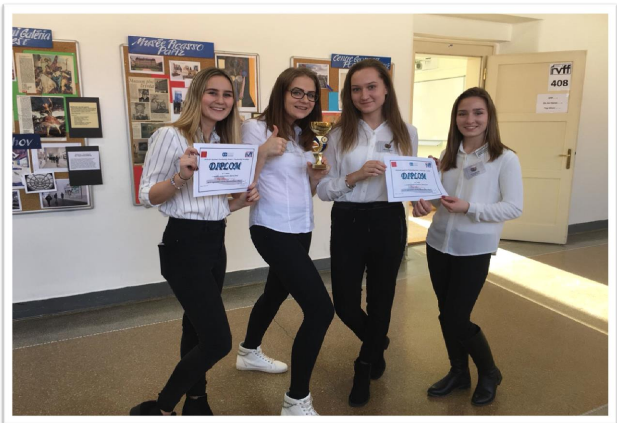
Top Silver, s. r. o. (žáci 3. D)